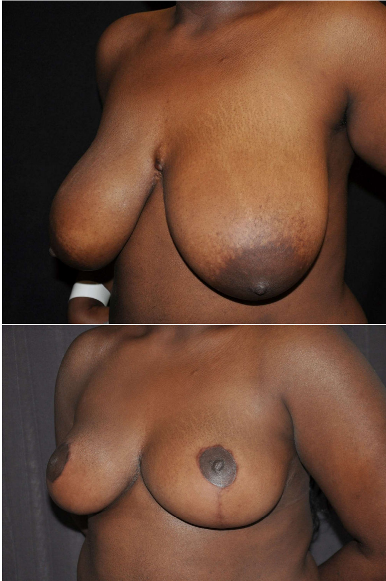
Figure 1. Patiente âgée de 19 ans présentant une hypertrophie importante du volume mammaire avec problèmes de douleurs chroniques du dos et des mycoses fréquentes dans le sillon sous les seins. Résultat à 3 mois (résection de 950 gr à droite et 1010 à gauche).